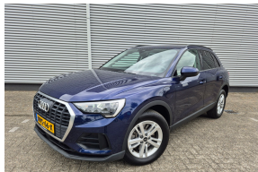
2e Pinksterdag open